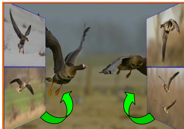
Die Türen schwenken auf und das Bild dahinter wird hell