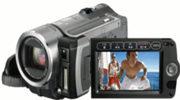
HD Camcorder Canon HF 100

Einen aktuellen Test über HD Camcorder finden Sie in der Zeitschrift „AudioVideoFoto“ Heft 7/2008 (Juni!). Auf dem 1. Platz liegt der HF 100 von Canon.